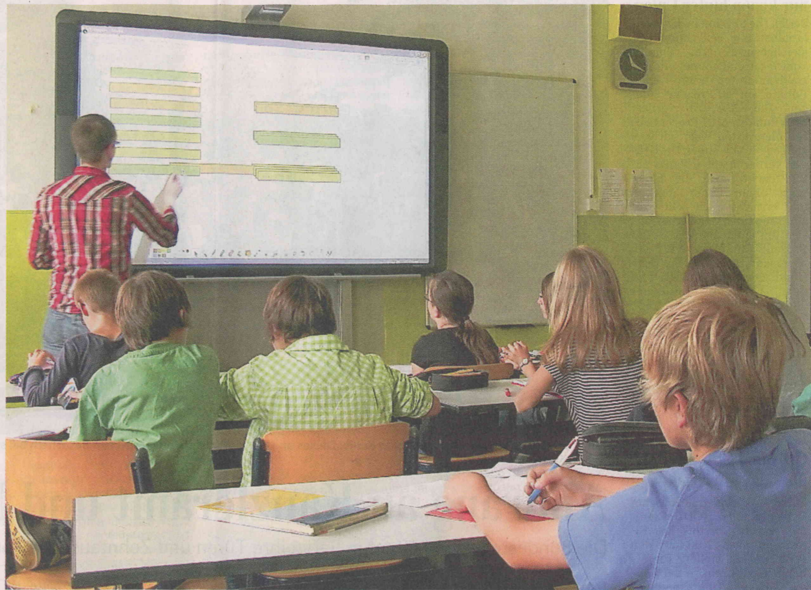
Ausbildungslehrer werden im Land schnell zur Unterrichtsvertretung herangezogen – der Referendar steht dann allein vor der Klasse.

Daran müsse sich aus Seibts Sicht, der in Cottbus auch Studi-